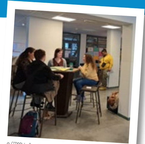
Brunch des coordinatrices des EDD du BW : tables d'échanges autour des souhaits des équipes (formations, événements...)

De manière ponctuelle ou pérenne, à l'initiative de l'une, de l'autre, ou des deux, il s'agit souvent de projets qui offrent une valeur ajoutée aux activités des structures respectives.