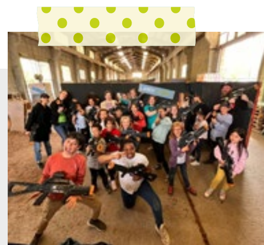
Activité Laser Game pendant la semaine