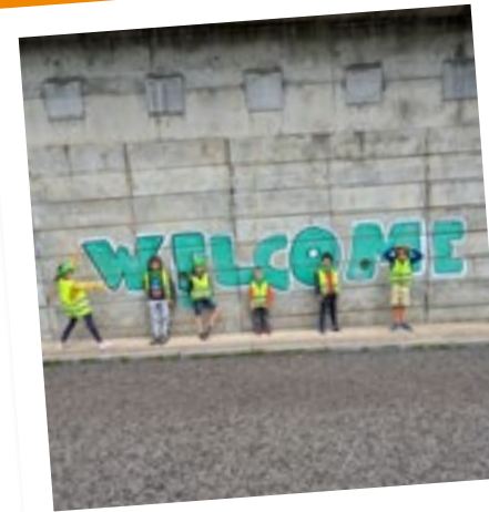
© COALA asbl - Plaine été 2023

Cela implique de retrouver derrière la porte ce qui a motivé de faire le pas : c'est tout le travail de l'équipe