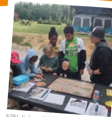
Séjour été 2023