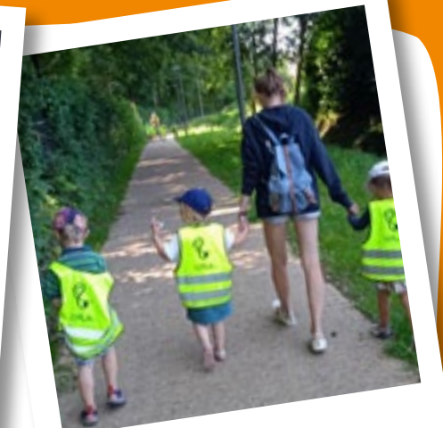
© COALA asbl - Plaine été 2023

d'animation amenée à évaluer ponctuellement les mesures concrètes mises en place.