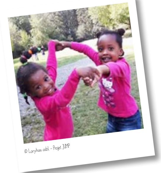
© Loryhan asbl - Projet JUMP